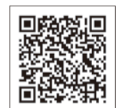
2次元コードで特設サイトにスマホからアクセスできます!

地域医療から最先端医療まで、深く探求し広く発信する大阪医科大学。その根底には自由な学風が息づく。「自由な発想で勉強できる大学ですが、卒業後も生涯学び続けなければなりません。それがわかる学生を一流の医療人に育てたいですね」