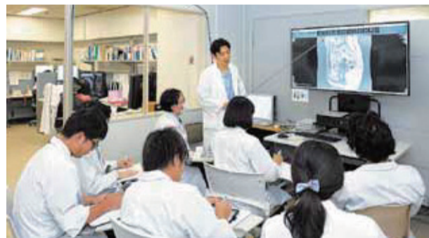
5・6年次で行う臨床研修

今年度からは、5・6年次生の成績上位者以外の学生に、国試対策のプロの講義を必須に。「受験勉強のペースメーカーをつけることで、効率的な自学自習を