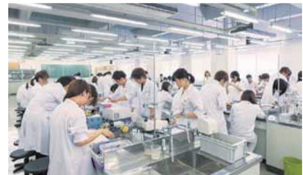
時代の要請に即した実習と演習