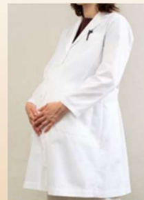
写真はシングル白衣