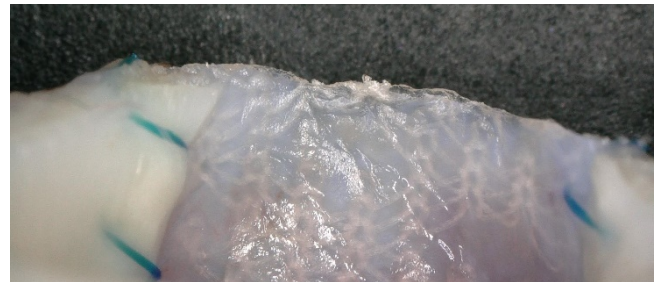
自己組織化された「OFT-G1」（非臨床試験時）